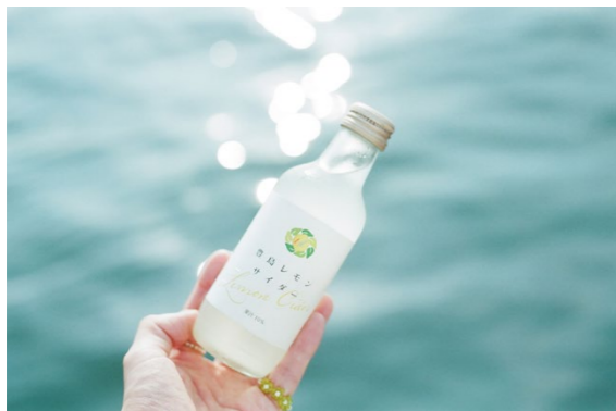
撮影場所／豊島(香川県)