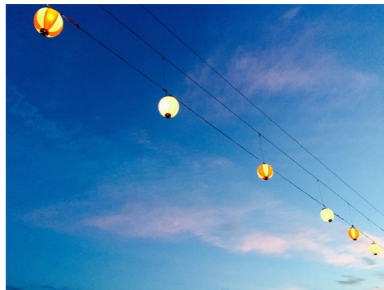
撮影場所／津山市(岡山県)

もうすぐ夏休みシーズンですね。 カメラを持って、夏を感じられる写真を撮りに出かけませんか？