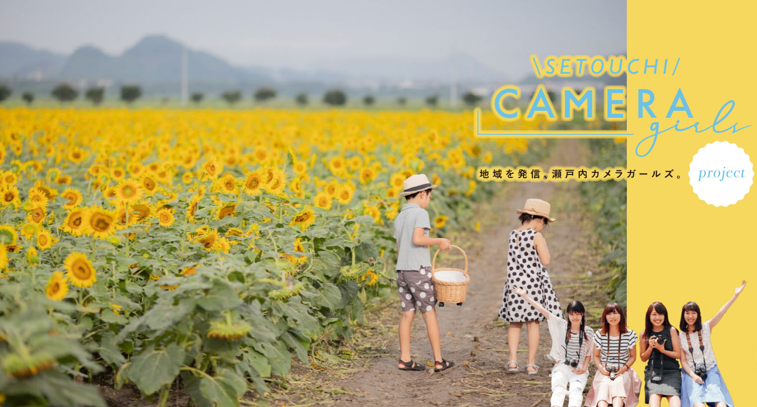
撮影場所／笠岡市(岡山県)