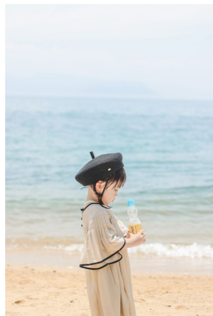
撮影場所／渋川海岸(岡山県)