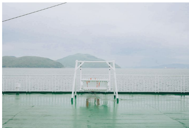
撮影場所 / 小豆島(香川県)