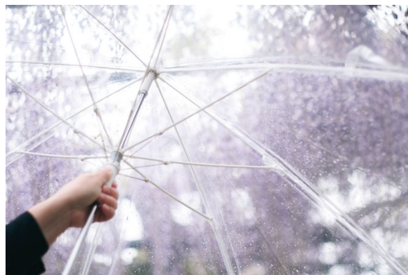
撮影場所 / 和気町(岡山県)