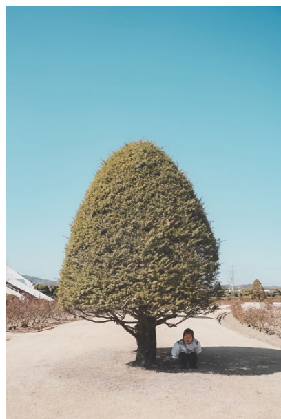
撮影場所／RSKバラ園(岡山県)