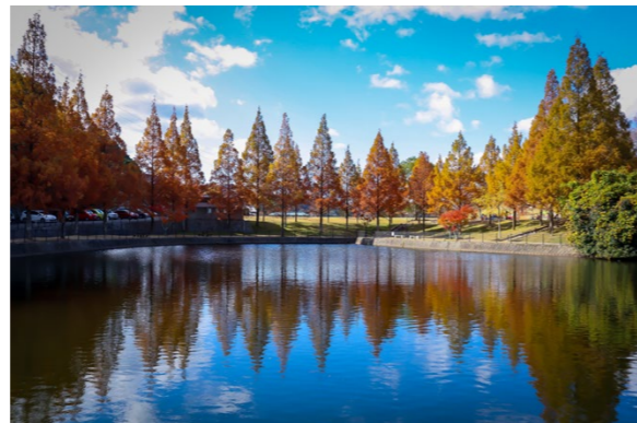
撮影場所／藤山健康文化公園(愛媛県)

季節によって、様々な表情を見せてくれる「木」。一度は写真に収めたことがあるのではないのでしょうか？ぜひ撮影の参考にしてみてくださいね。