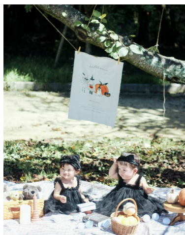
撮影場所／酒津公園(岡山県)

気候も心地よく、紅葉といった景色も美しい秋は、まさに写真撮影にうってつけのシーズンです。ぜひ撮影の参考にしてみてください。