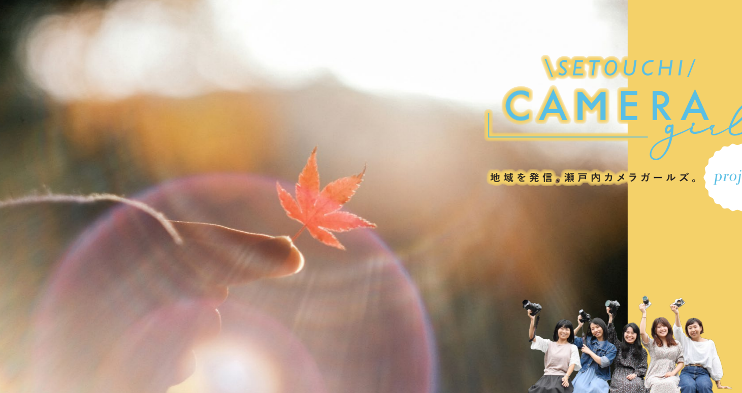
撮影場所／吉備中央町(岡山県)