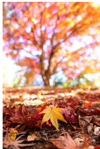
撮影場所／高梁市成羽町(岡山県)