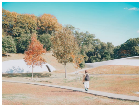
撮影場所／豊島(香川県)