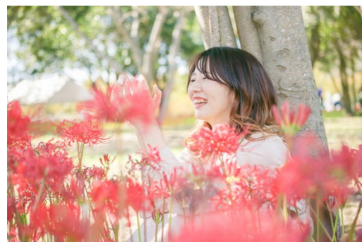
撮影場所／児島湖(岡山県)