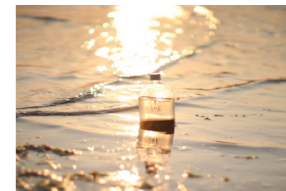
撮影場所/父母ヶ浜(香川県)