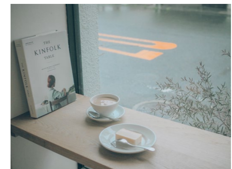
撮影場所/ 玉野市(岡山県)