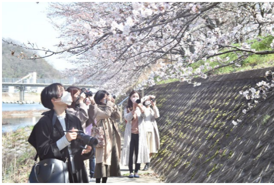
井原堤のサクラはこの日はまだ2分咲きでしたが、咲いている場所を見つけては思い思いにサクラを撮影しました。