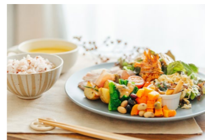
撮影場所/自宅