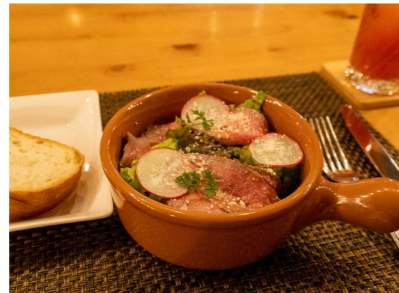
星空撮影前に井原市美星町の「星空ペンションコメット」にて、夕食もいただきました。オーナーさんに美星の星空について教えてもらえてラッキーでした!

岡山県井原市で星空撮影会を開催しました! またこの時期はちょうどサクラの開花時期でもあったので、井原堤でサクラも撮影してきました。