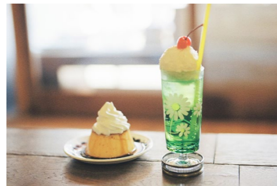
撮影場所/直島(香川県)