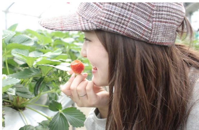
撮影場所 / 岡山市サウスヴィレッジ(岡山県)

イチゴがおいしい季節がやってきました。イチゴ狩りに行った際やおうちフォトを楽しむ際に、参考にしてみてくださいね。