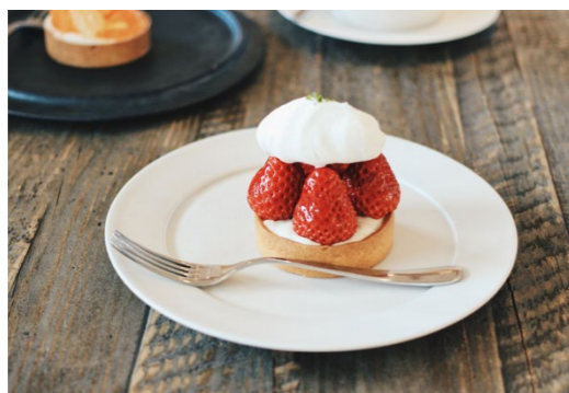
撮影場所 / 倉敷市(岡山県)

瀬戸内カメラガールズに登録して、毎月3日までに下記から瀬戸内エリアの写真を投稿ください。優秀作品は『タウン情報おかやま』に掲載! 採用された人には掲載誌をプレゼント。 https://www.camera-girls.net/event/session/setouchipc/