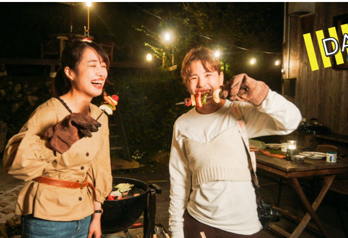
夜はグランピング&BBQ! 自然の中で食べるとさらにおいしい! 「農家民宿 福屋(美作市)」

岡山県内でも最近増えている農家民宿。 吉備中央町や勝央町、真庭市などを訪れ、 農家の暮らしを体験する1泊2日の旅に行ってきました。