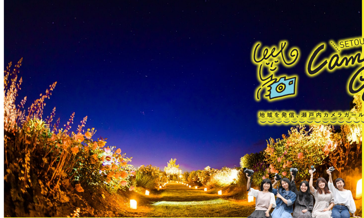
撮影場所 / そらの花畑 世羅高原花の森(広島県)