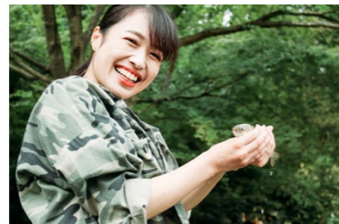
ヤマメのつかみ取りは、子どもの頃に戻ったようでワクワク。 そば打ちにも挑戦しました。 「クリエイティブ谷(真庭市)」