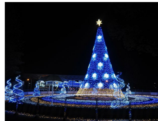
撮影場所 / 水島中央公園(岡山県)

今年ももうすぐ冬がやってきますね。 今月は、カメラガールズがそれぞれの目線で 切り取ったイルミネーションの写真をご紹介します。