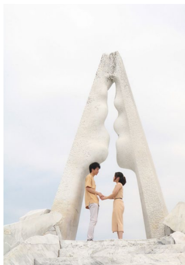
撮影場所／未来心の丘(広島県)

恋人や友人と過ごす幸せな時間、 趣味を思い切り楽しむ時間など それぞれの「青春」を切り取った写真が届きました!