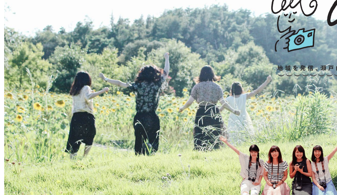
撮影場所／ 国営讃岐まんのう公園(香川県)