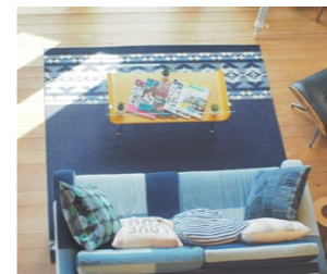
コテージの室内はデニムを基調としていて、とってもかわいいお部屋でした!