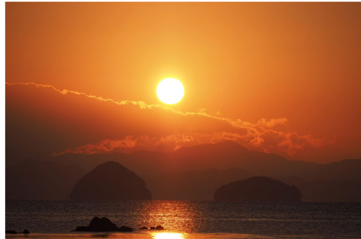
撮影場所／さぬき市(香川県)