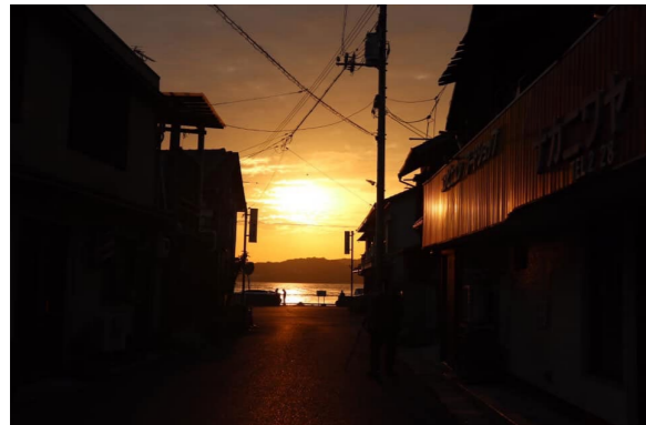
撮影場所／牛窓(岡山県)

初日の出の写真が多く集まりました。一年に1度の朝景色。初日の出をメインに、海や雲海などのシチュエーションによって、雰囲気が変わります。ぜひ参考してみてくださいね。