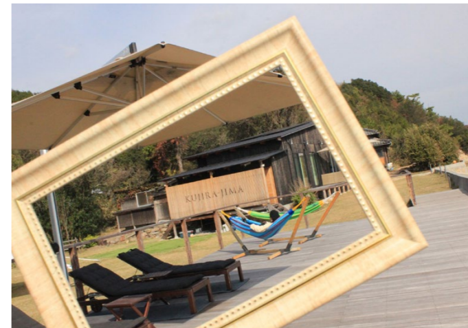
みんなで小物を持ち寄って楽しめました

玉野市・宇野港から船で40分ほど揺られると見えてくる「くじら島」は、一日1組限定の貸切り無人島。今回は、瀬戸内カメラガールズで貸切って、撮影女子会を開催しました。彼女たちが撮影したすてきな写真も必見です!