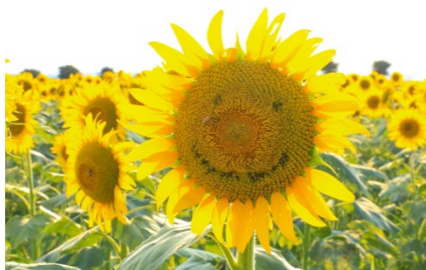
撮影場所 / 笠岡ベイファーム