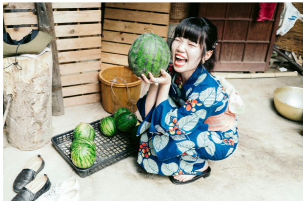
撮影場所 / 男木島(香川県)