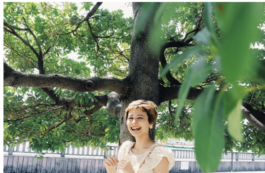
撮影場所 / 尾道市内(広島県)