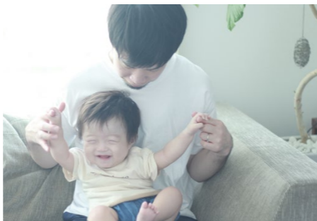
撮影場所 / 倉敷市内