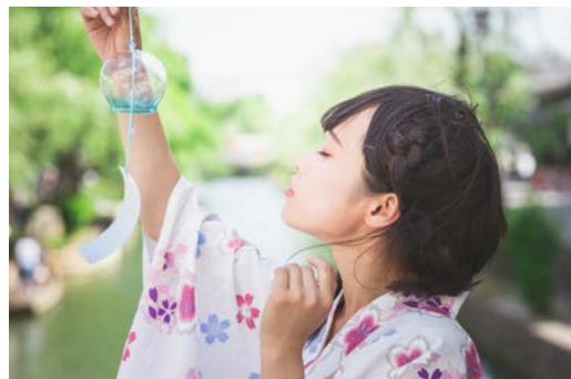
撮影場所/倉敷美観地区(岡山県)