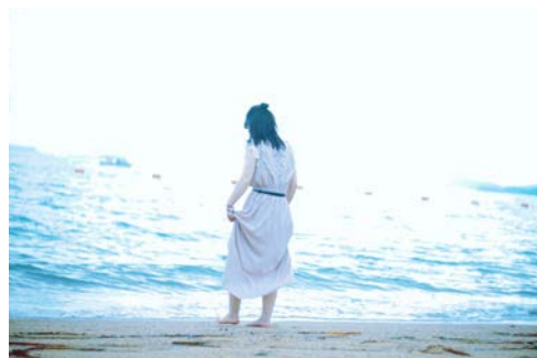
撮影場所/渋川海水浴場(岡山県)

今回は海やプール、水族館で撮影した写真をたくさんご応募いただきました。やはり水の映ったさわやかなブルー系の写真は、涼やかな気持ちにしてくれますね。