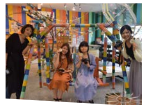
多種多様なマスキングテープでそろそろ「倉敷マスキングテープギャラリー〜MTG〜」で、缶バッジ作りも。みんなで記念撮影パシャ!