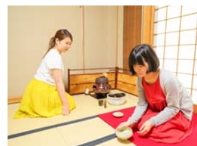
倉敷市玉島では、「器楽堂老舗」でお茶体験! 初めてでも丁寧に教えていただけるので安心です。心落ち着く和やかな時間になりました