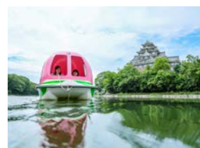
「岡山城」と「岡山後楽園」の間を、「どんぶらこ〜」。桃型ボートで水上散歩しながら、みんなで撮影しました